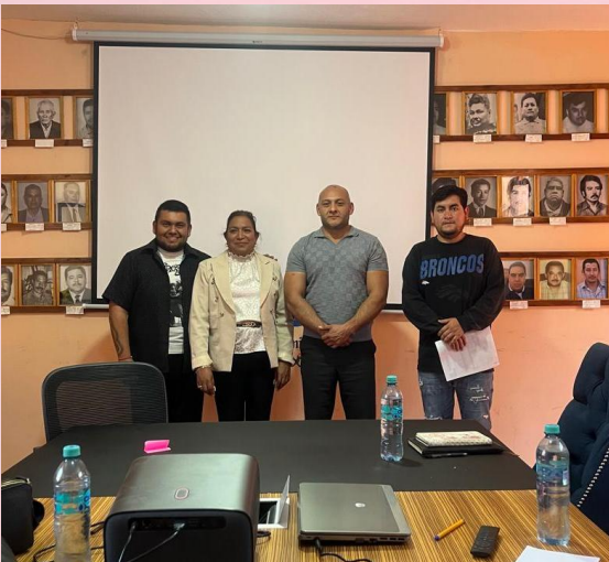
Educación del Municipio de Xichú