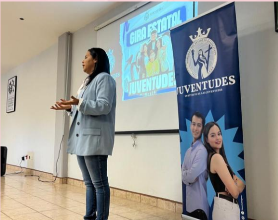
Reunión Regional de Juventudes