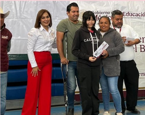
Inauguración de Centro de Atención de Becas para el Bienestar en el municipio de Doctor Mora