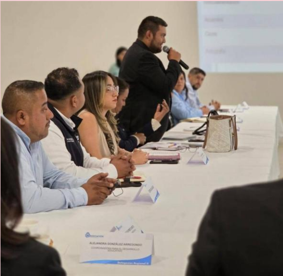
Reunión Regional de Educación