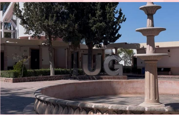
Superior de San Luis de la Paz

Visita a Escuelas de Nivel Superior de la