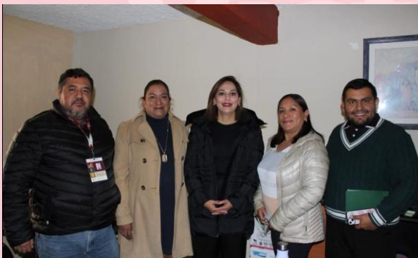
Becas para el Bienestar