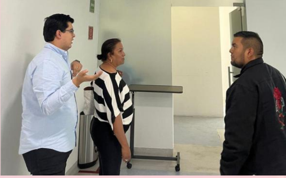
Visita a Hospital Moscati para gestionar feria de servicios médicos