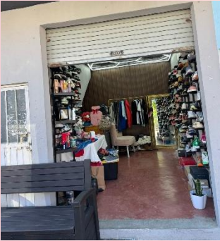
Construyendo el Futuro