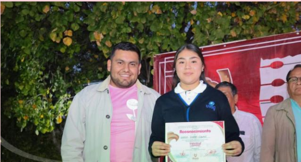
Amor y la Amistad