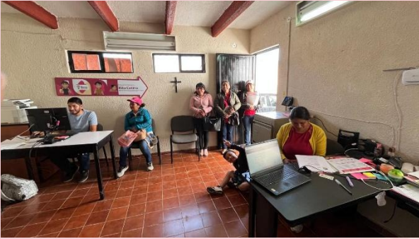
Inscripción a Beca Rita Cetina