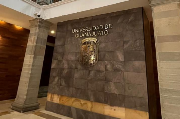
Capital de Guanajuato

Visita a Escuelas de Nivel Superior de la