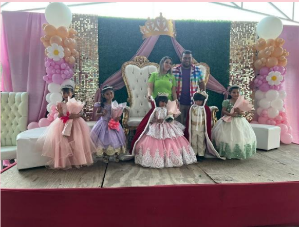
Jurado Calificador en Preescolar Gabriela