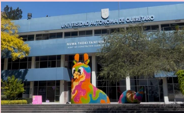
Estado de Querétaro