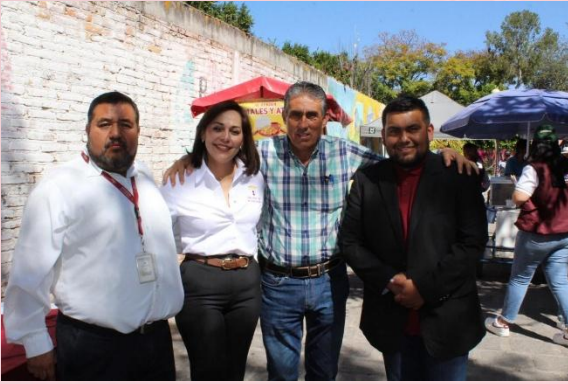
Becas para el Bienestar