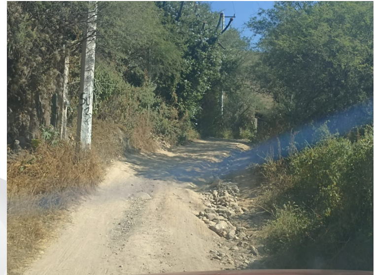
Calle en la localidad de Milpillas de Santiago