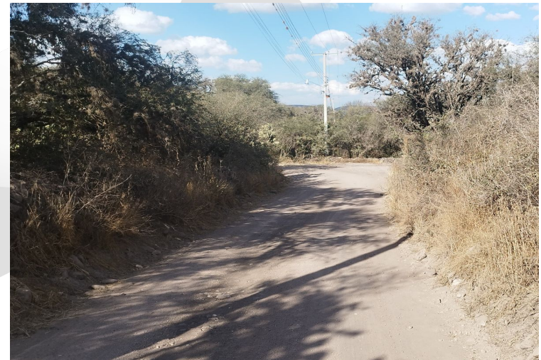
Camino Rural El Carmen - Capilla Blanca