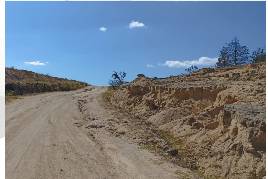
Camino Rural Las Chivas - Milpillitas del P.