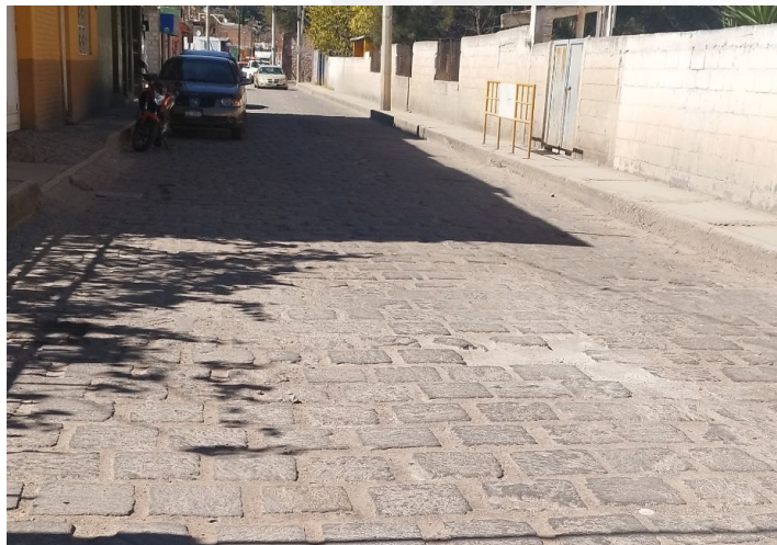
Calle 16 de Septiembre en Cabecera Municipal