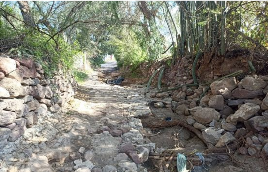
Calle en la localidad de Los Remedios