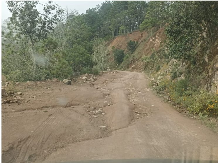
Camino Rural Joya Fría - El Obispo